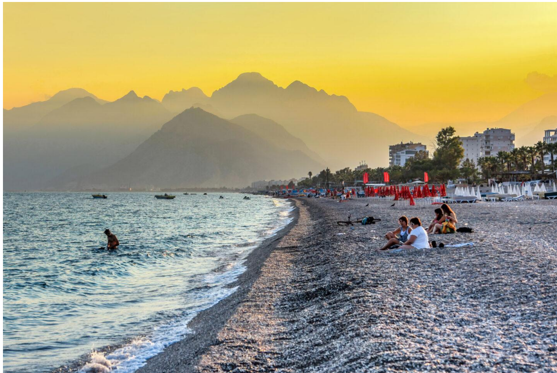
COP31開催地アンタルヤ